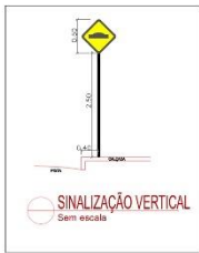
SINALIZAÇÃO VERTICAL Sem escala

Legenda Sinalização: - Sinalização vertical e horizontal conforme Resolução nº 183, de 28-08-2005, Conselho Nacional de Trânsito (CONTRAN).